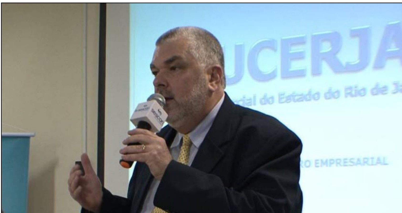
Iniciativa da Jucerja agiliza processo de abertura de empresas em todo o estado