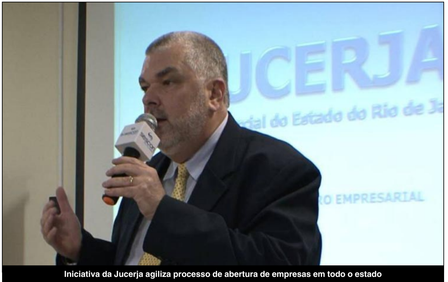
Iniciativa da Jucerja agiliza processo de abertura de empresas em todo o estado

– Ainda que esse empenho na descentralização e da desburocratização, que teve início no estado em 2015, demonstre bons resultados, a adesão cabe aos municípios. E a toda cidade que sinalize o desejo de utilizar esse sistema informatizado, a Jucerja garante a disponibilização do sistema e o treinamento aos servidores locais, sem qualquer ônus – disse Velloso.