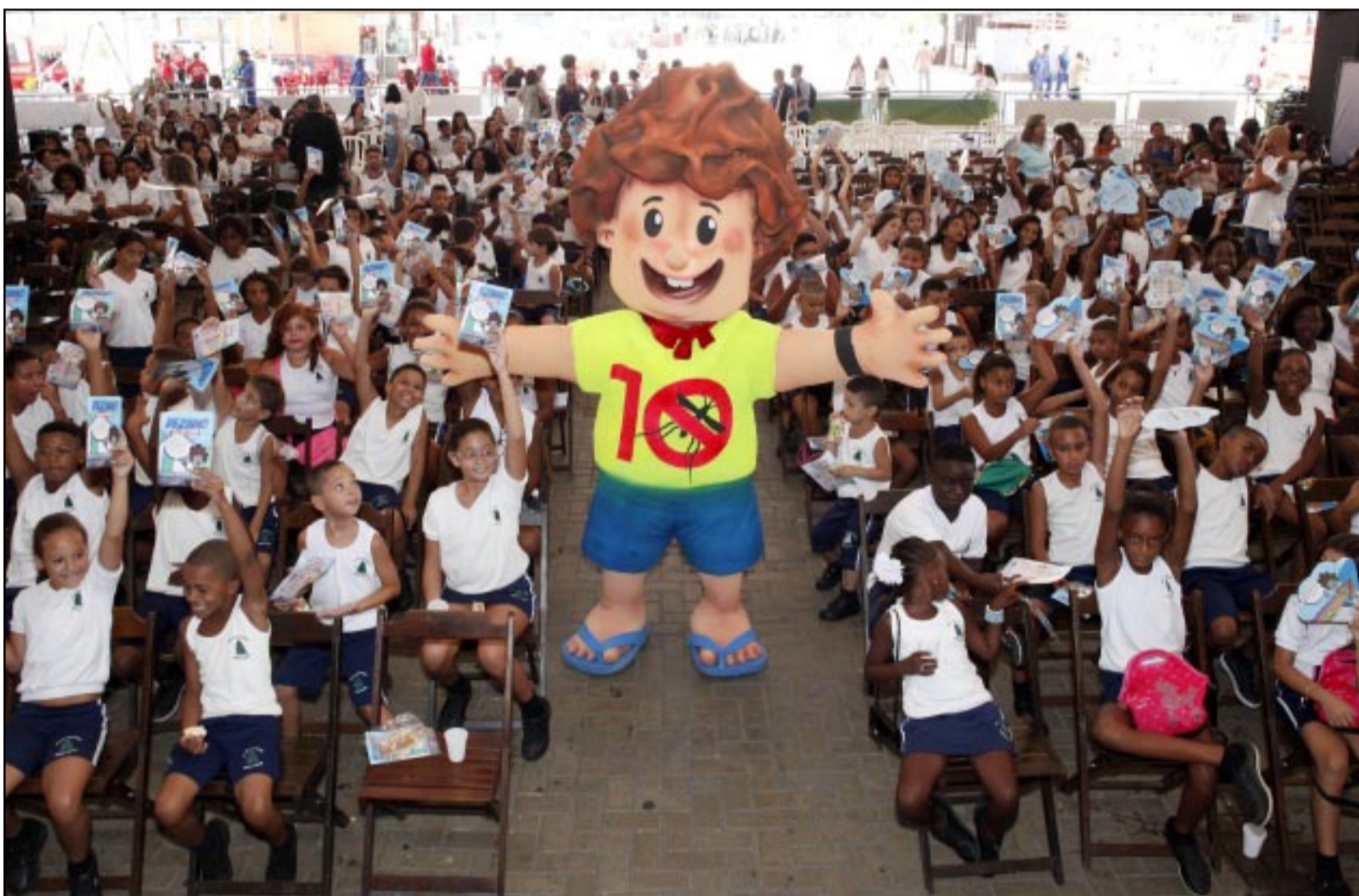
Objetivo é mobilizar a população a adotar medidas simples em casa

■ A Secretaria de Saúde lança campanha para o combate ao mosquito Aedes aegypti no estado. A campanha publicitária, que está sendo veiculada em rádios, TVs e veículos online, tem o objetivo de mobilizar toda a sociedade, mas principalmente o público infantil, por meio do personagem Dezinho. O verão começa em 21 de dezembro e a campanha se antecipa à data, com a finalidade de alertar a população em relação às medidas de prevenção e controle. Materiais para imprimir – como panfletos e um jogo dos 10 erros – e adesivos Morador Nota 10 para serem colados nas residências durante visitas dos agentes da Vigilância Sanitária estão disponíveis com licença Creative Commons (sem limitações de direitos autorais) no site www.riocontraoaedes.com.br . Além do material disponível no site, também estão livres para download tirinhas em quadrinhos com as aventuras do Dezinho e sua família, GIFs animadas e vídeos, para postar nas redes sociais e compartilhar pelo Whatsapp. Tudo com dicas de como combater o mosquito no dia a dia. Um boneco de espuma representando o personagem também vai percorrer os municípios do Estado do Rio de Janeiro nas ações de prevenção à dengue, zika e chikungunya. PÁGINA 8