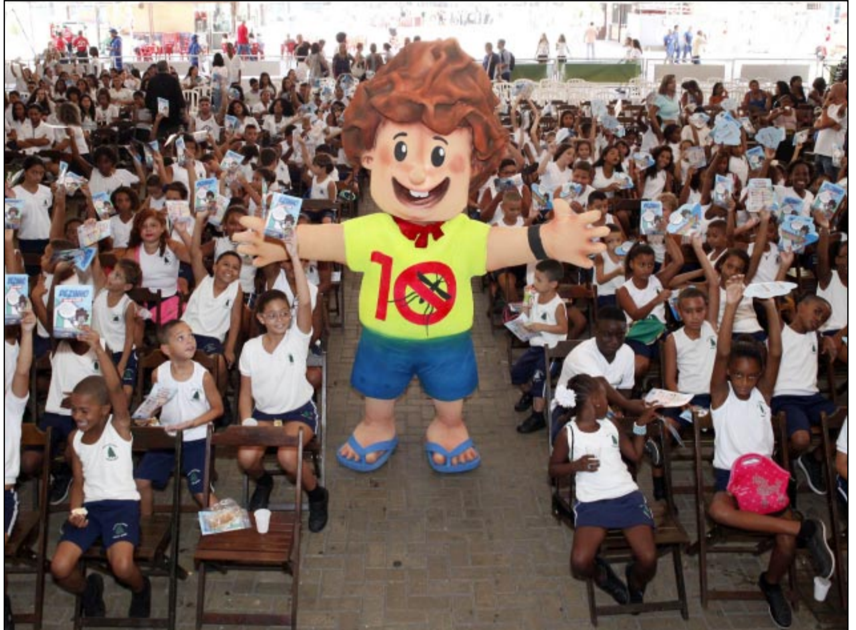
Objetivo é mobilizar a população a adotar medidas simples em casa

Apenas dez minutos por semana é tempo suficiente para que uma pessoa olhe todos os possíveis focos do mosquito nas residências. A vistoria deve acontecer em caixas d'água, tonéis, vasos de plantas, calhas, garrafas, lixo e bandejas de ar-condicionado. Com essas medidas de prevenção, é possível evitar a proliferação do Aedes aegypti .